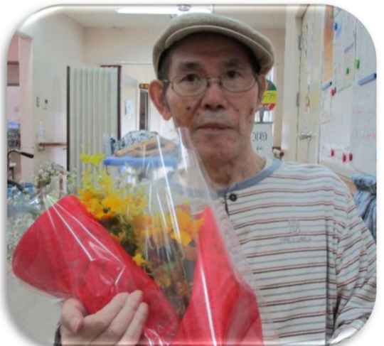
トレードマークの帽子と一緒に福山様