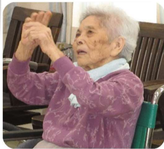
音楽に合わせて踊りだす傅様