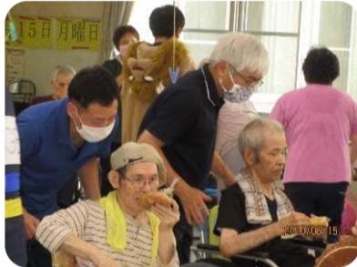
パン食い競争の一場面