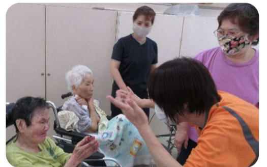
職員と一緒に踊られる重様