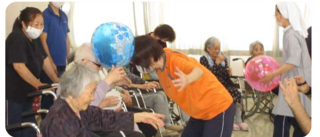
ボール競技の風景 職員とボールの突き合い