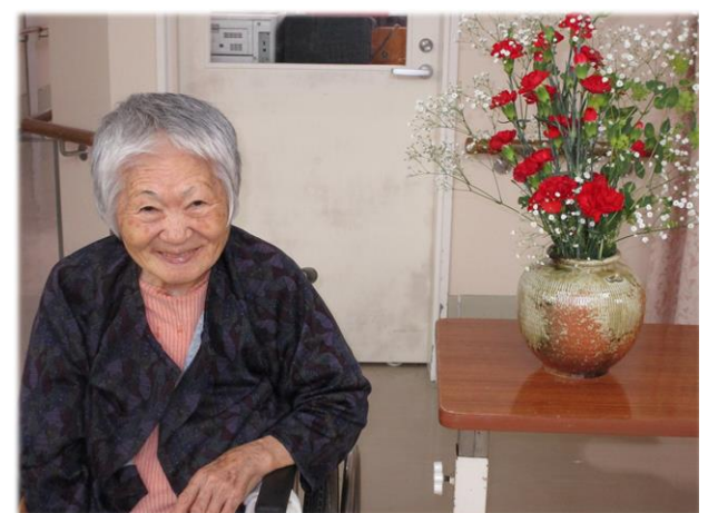
「もう一枚撮って!」とリクエストされる方も…!